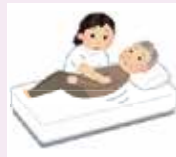
苦痛の緩和・終末期ケア