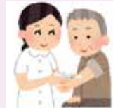
医療処置（治療上の看護）