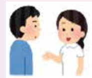
家族への支援・相談