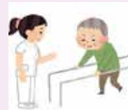
リハビリテーション