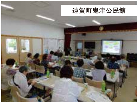
遠賀町鬼津公民館

地域の老人会や体操教室、ふれあいサロンなどの開催日にご依頼をいただくことが多く、一時間程度の講座を皆さん熱心に聞いてくださっています。実際にご家族が在宅医療を受けたことのある方や、在宅医療のことを初めて知ったという方まで、参加者の方々の認知度は様々ですが、「一度の参加ではまだわからないので、少しずつ理解を深めていきたい」などの声が聞かれています。