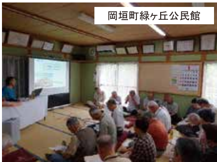
岡垣町緑ヶ丘公民館

地域の公民館へ在宅総合支援センターの職員がお伺いし、地域の人口の推移や医療の今後の課題などの背景の部分から、在宅医療でできることは何か？在宅医療でのサービスや活用方法についてのお話をしています。