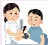
症状の観察・健康状態の管理