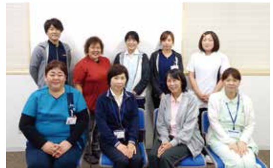
訪問看護ステーションの管理者の皆さん

医療機関（診療所や病院）や訪問看護ステーションの詳細情報は在宅総合支援センターホームページ上の「 資源リスト 」に掲載されていますのでご参照ください。